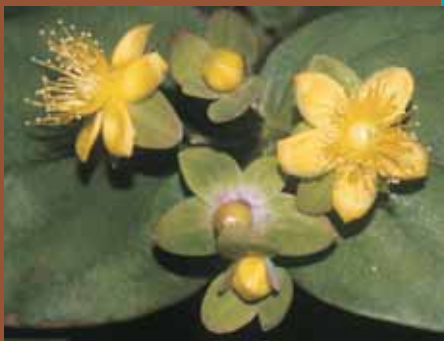
▲ Alfavaca da cobra

▶ Este camiño comeza na pequena aldea do Vilar. Dous paneis interpretativos fannos o resumo tanto das súas características como dos principais elementos que nel atoparemos. Ao longo da ruta teremos información máis precisa sobre a flora, a fauna, a vida do rego e os muíños que alberga.