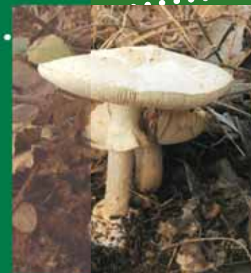
▲ Amanita citrina

▶ Os últimos dous quilómetros, achégannos de novo ao rego de Rimontes e as carballeiras, neste caso a nosa dereita. No último tramo destacan as sobreiras ou corticeiras, algunha delas de considerable idade e outras máis novas. Logo de cruzar a ponde sobre o regato tornámonos no mesmo lugar onde iniciamos o camiño.