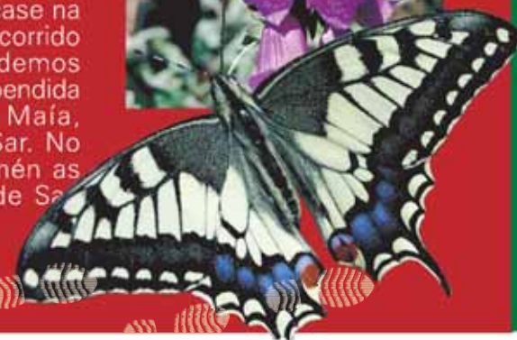
▶ Cola de anduriña