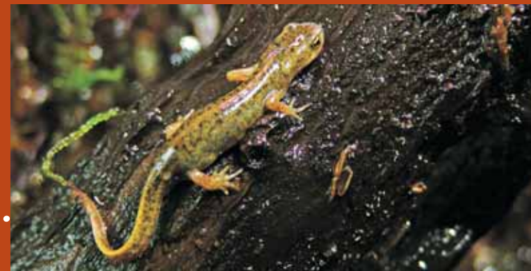
▲ Pintafontes común

▶ Unha pista forestal lévanos dende o Pozo ata a estrada que comunica Castelo con Cortegada. Só faremos vinte metros, cara á dereita, por esta estrada xa que, deseguida, entramos nunha pista forestal, sinalizada á nosa dereita.