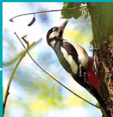
▲ Peto real

▶ Logo de acceder a unha pista forestal, deseguida chegamos ao primeiro dos muíños, o de Ortoño, o único situado na beira dereita do regato de Riamontes. Cruzamos o rego por unha pontella e deixamos o río a nosa esquerda. O camiño segue por un fermoso tramo de bosque de ribeira. Os freixos, ameneiros e, máis retrasados, os carballos proporcionan a penumbra e humidade necesarias para que medren fentos, carrizos e moitas especies da flora típica de ribeira que serven de refuxio a unha enorme variedade de insectos e pequenos vertebrados. Ao longo deste tramo o rego, cheo de vida, baixa saltando de penedo en penedo entre pozas e pequenas fervenzas custodiado por 10 muíños, o Novo, o da Xustiza, o da Pedra..., que manteñen o seu misterio de tradicións e de historias.