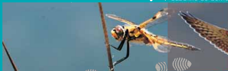
▶ Lagarteiro común

▶ Ao remate deste camiño chegamos ao Pozo de Riamontes un lugar onde, durante o verán, represábase auga para que funcionasen os muíños. Na actualidade, moitos animais achéganse ao pozo para beber e refrescarse, proba diso son as pegadas que podemos observar nas zonas lamacentas, sobre todo, nas primeiras horas da mañá.