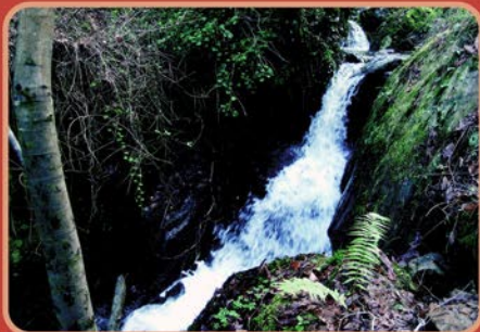
No percorrido a paisaxe adórnase de pequenas ferreznas. Os muíños ascenden en suave pendente e adóptanse ó terreno. En el recorrido el paisaje se adorna de pequeñas cascadas. Los molinos ascienden en suave pendiente y se adaptan al terreno.