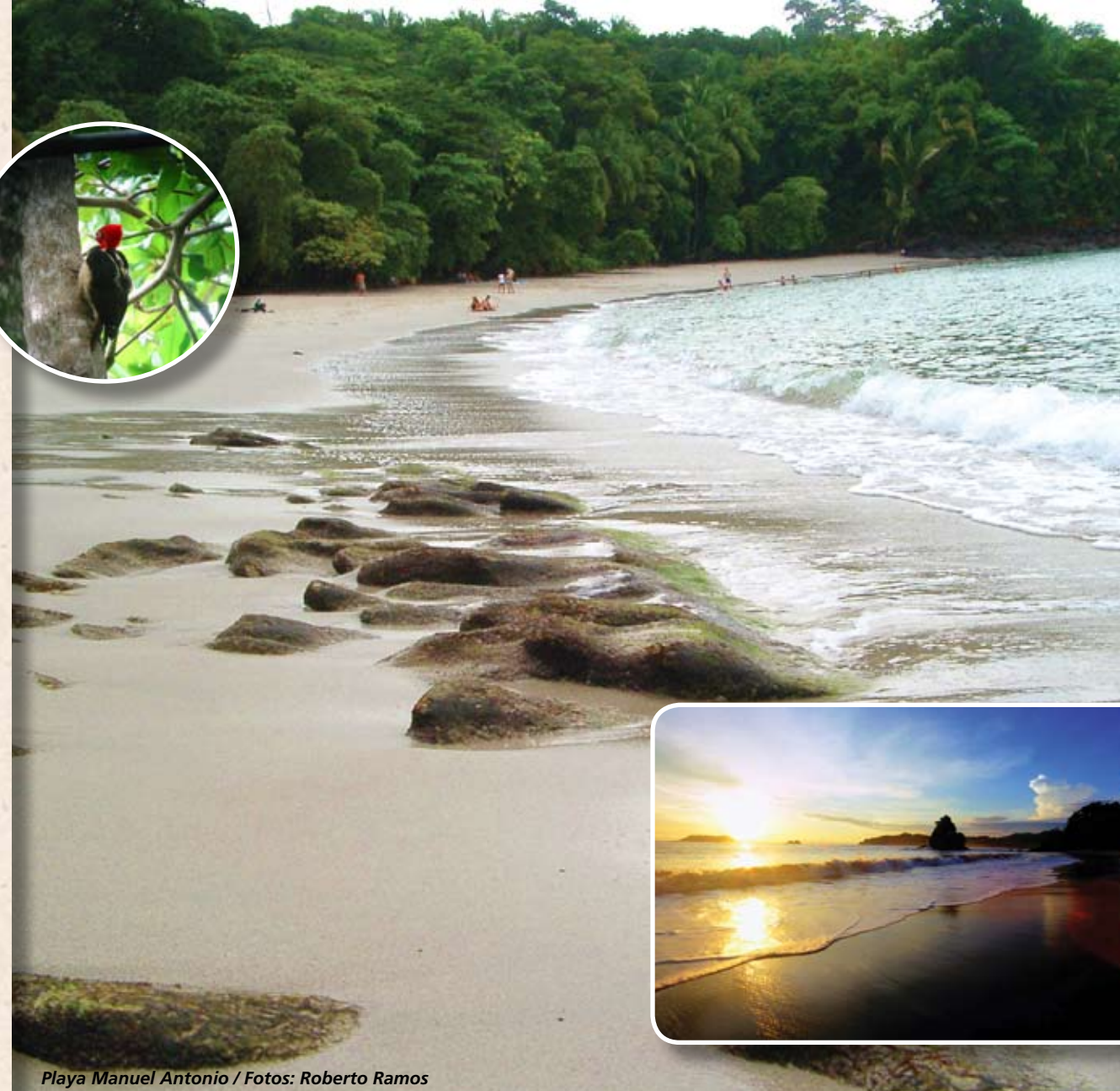
Playa Manuel Antonio